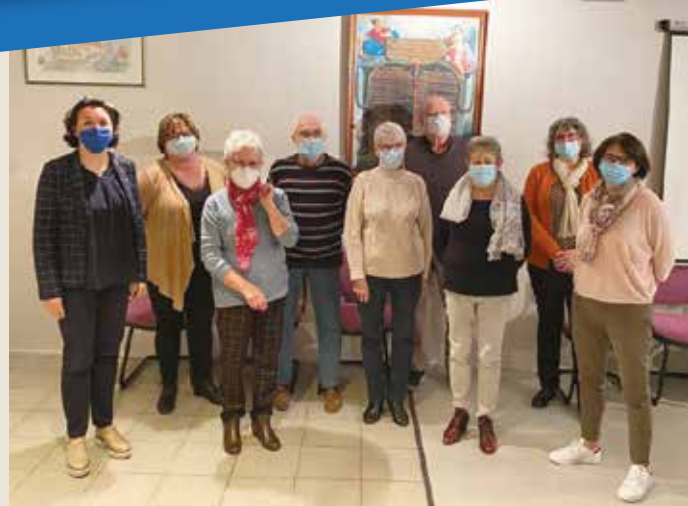
Les membres du CCAS de gauche à droite :

Rappel : Une permanence de l'assistante sociale a lieu le 1 er jeudi de chaque mois. Prendre rendez-vous à la Maison des Solidarités de Montmorillon au 05 49 91 11 03.